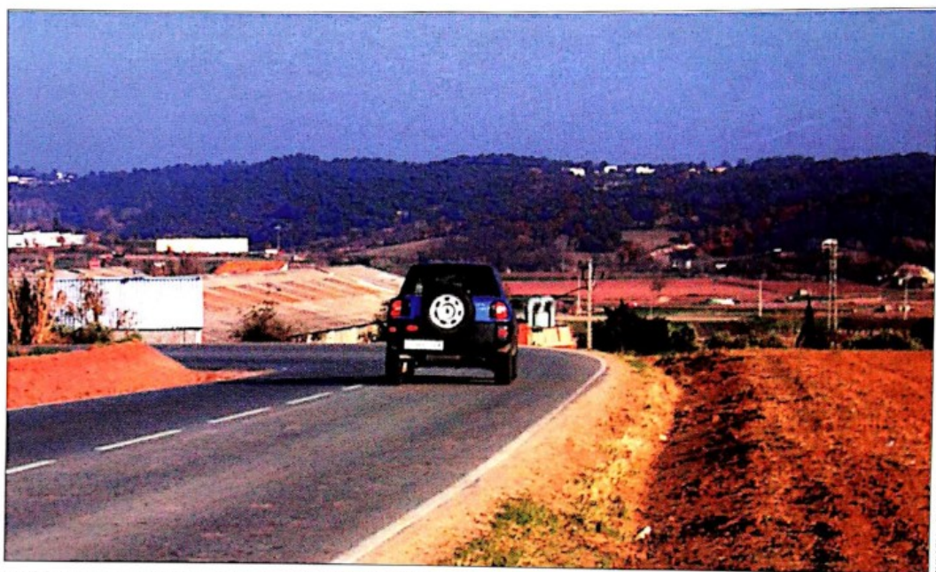
Un dels punts de desacord és el nou traçat de la carretera de Sentmenat, que es vol connectar amb la B-143 fora del nucli urbà

El ple de l'Ajuntament debatrà dijous l'aprovació del Pla General i, ara com ara, i a l'espera de possibles canvis d'última hora, les postures entre equip de govern i oposició no són massa properes. El consens, aconseguit en l'aprovació del Pla 125 -declaració d'intencions del Pla General- es va trencar amb la signatura del conveni entre Ajuntament i promotor de Can Valls, i el consegüent augment de la zona edificable a la urbanització. L'oposició tampoc està d'acord amb la no inclusió del Quart Cinturó en el document. CiU i ERC consideren que el fet es queda en una mera declaració d'intencions que podria anar més enllà, mentre que el PP defensa que s'inclouï el traçat de la via, ja que la Generalitat obliga a fer-ho. El fet d'afegir a la finca de la Torre Marimon la qualificació de 'jardí zoològic', també distancia les postures de govern i oposició.