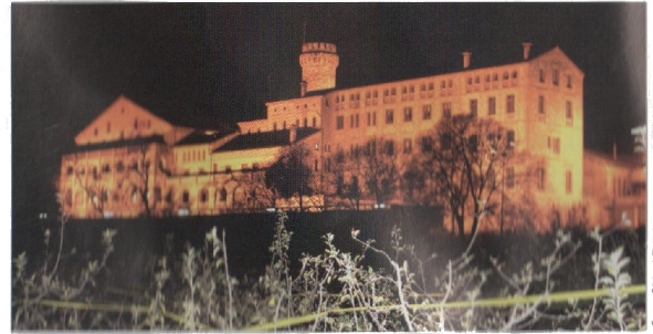
Generalitat i Diputació donen el vistiplau al document redactat per l'IRTA